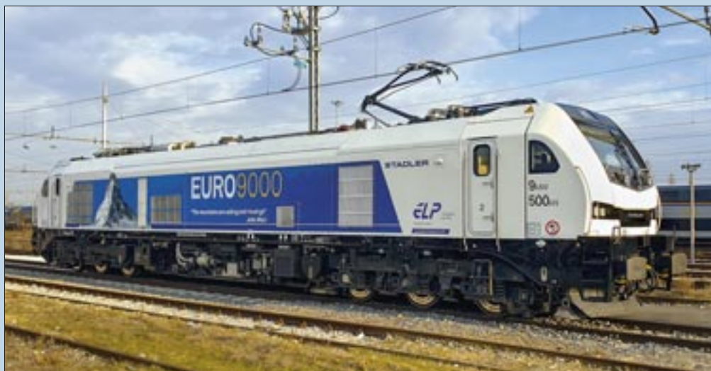
Im Jahr 2020 fertigte der Hersteller zunächst zwei Prototypen für die Erprobung und Zulassung des neuen Loktyps in verschiedenen europäischen Ländern (im Bild die Prototyplok 2019 300).